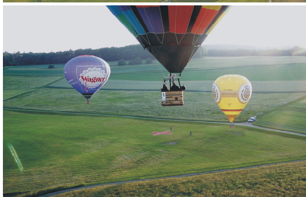
Günter Dornheim (Text u. Bilder)