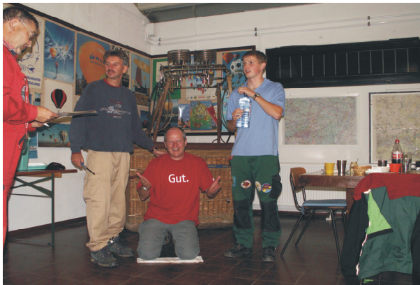
Günter Dornheim (Text u. Bilder)